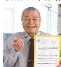
オリジナル指圧器具 図面一式、取扱説明書