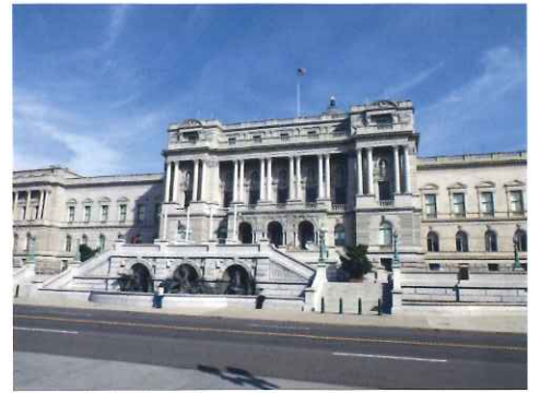
米国著作権局外観 (2011年撮影)

合衆国連邦政府 立法府 所属機関 アメリカ合衆国 コピーライトオフィス (米国著作権局)