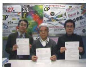
商品カタログ、パンフレット 企画中のビジネスプラン等